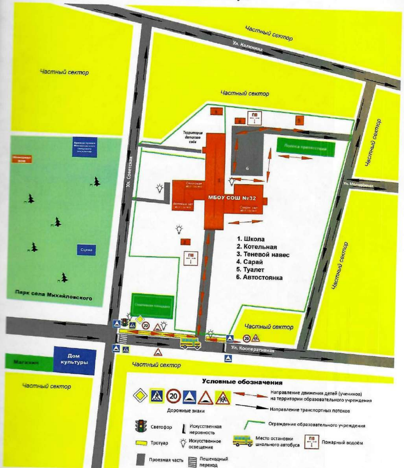
Схема организации дорожного движения в непосредственной близости от МБОУ СОШ №32 с размещением соответствующих технических средств, маршрутов движения детей и расположения парковочного места автобуса